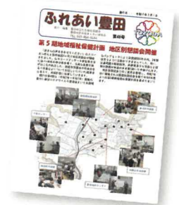
広報紙「ふれあい豊田」による地域情報発信