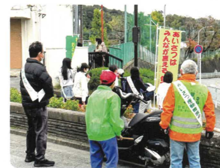
登校時のあいさつ運動