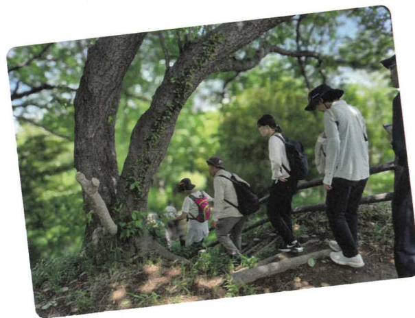
仲間と健康づくりウォーキング