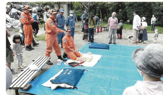
各町内会自治会での防災訓練