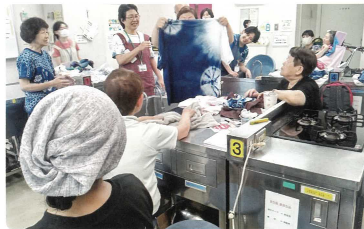
誰もが参加しやすい交流の場