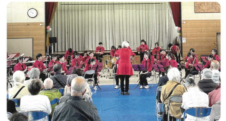
多世代の交流の場「社協ふれあいの集い」