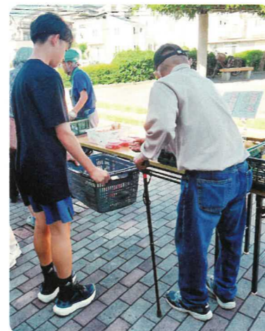
中学生によるボランティア活動