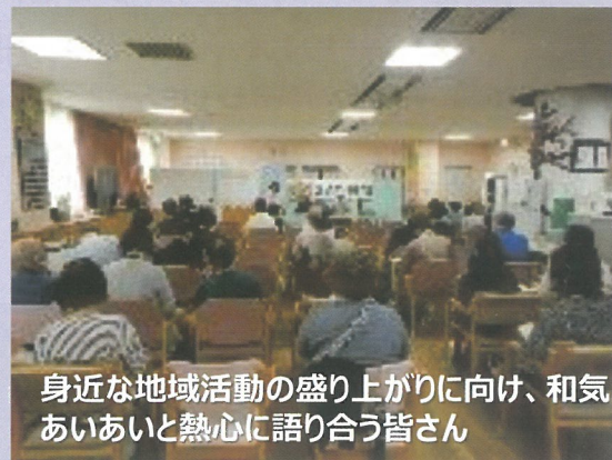
身近な地域活動の盛り上がりに向け、和気あいあいと熱心に語り合う皆さん

地域の福祉保健という意味では、各町内会・自治会が事業計画に沿って進めている各種事業が、つながるプランに直結しております。集いの場、地域のお祭りなどは、一人では成立せず、多くの関係者による組み立て過程が、いざという時の助け合いの訓練にもつながります。そして多世代様々な人が参加協力することにより、一体感が醸成されます。