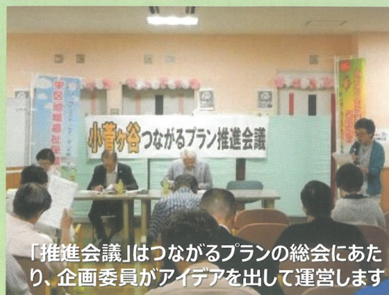
「推進会議」はつながるプランの総会にあたり、企画委員がアイデアを出して運営します