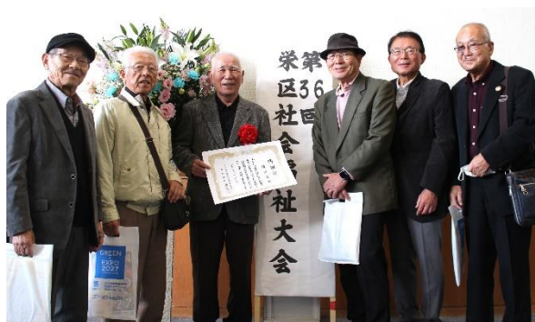
〈 遊楽舎の皆さん 〉

また、埋蔵文化財センター地域利用施設管理運営委員会の事務局として利用41団体のとりまとめを行うなど、地域住民の活動の後方支援を行ってきました。