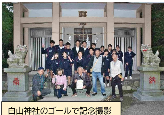
白山神社のゴールで記念撮影

上郷地区社協は、4組の「ウォークラリーを通して地域の高齢者との交流」に協力しました。ウォークラリー当日は、生徒が考えた2コースに分かれて日枝神社、機織り地蔵、思金神社、白山神社などのポイントをまわりました。生徒の感想にもありましたが、短時間で歩くのに精いっぱい十分な交流には課題が残りました。全校発表会では、各組の代表からパワーポイントや制作物で報告があり、楽しく頼もしく聞きました。