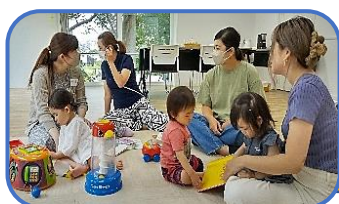
「皆で仲良くお部屋遊び」