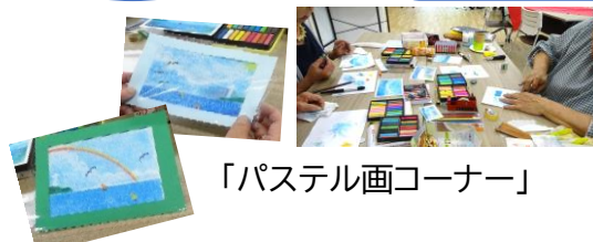
「パステル画コーナー」