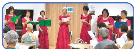
「サロン 庄戸」オープン記念コンサート ～コーロ・アマンテの皆様～