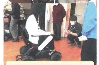
軽い力で動くのわ！