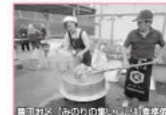
笠間地区「みのりの集い」