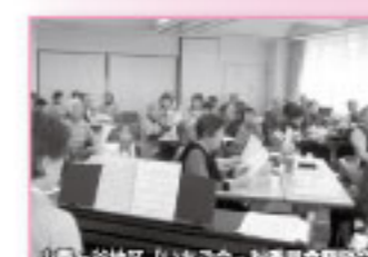
小菅ヶ谷地区「いちご会」