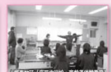
上郷東地区「上郷中学校・高齢者体験教室」