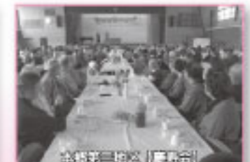
本郷第三地区「敬老会」