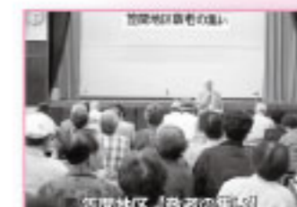
笠間地区「敬老の集い」