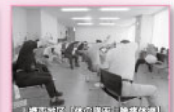
上郷西地区「体の講座」