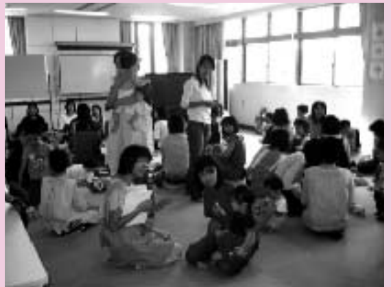
【ティーサロンの風景②】