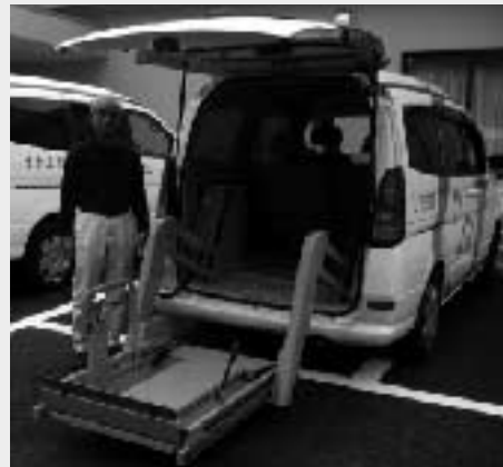
【湘南号の車椅子用リフト操作中】

利用している車は日本財団の支援金で購入した福祉車両”湘南号”と運転ボランティアの自家用車です。湘南号については、保険料・車検代・保守費・駐車場料金・ガソリン代・など維持費も中々大変で、これらの費用は会員の入会費・年会費・利用料金・助成金などで賄われているそうです。