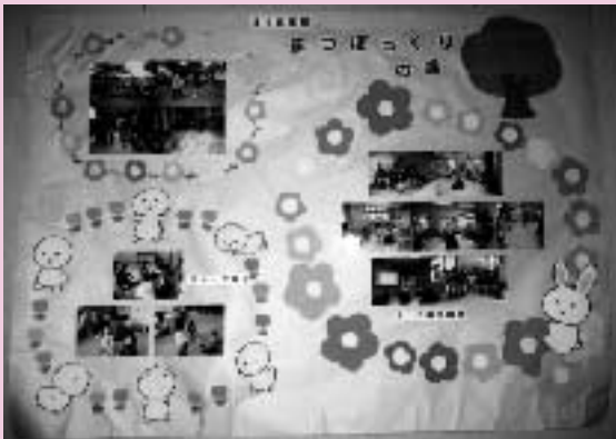
【会の活動紹介ポスター】

お知らせ 栄区社会福祉協議会では、交通遺児の方に対する見舞金・激励金交付支援を行っております。詳細は電話にてお問い合わせ下さい。