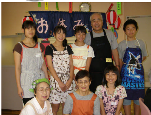
小菅ヶ谷地域ケアプラザのお祭り