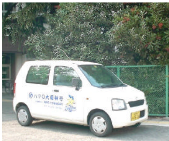
小さいけれど、毎日大活躍の大魔神号