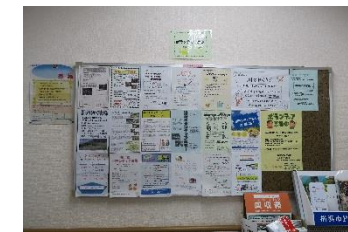
ボランティア募集の掲示板

ボランティアと聞くととても大仰（おおぎょう）な活動のイメージがありますが、ほんとうに日常の些細なこと、例えば通学路の見守りや道路（植込みの中）の草取りやゴミ拾い、家具の修繕・組み立てなどでも構わないということなので、少しでもボランティアに興味のある方、何かお手伝いしたいなあ～と考えている方、趣味や特技を生かしてみたい方があれば、気軽にボランティアセンターへの登録をしてみたいかがでしょうか。