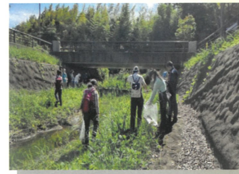
いたち川の清掃 (上郷地区センター周辺)

そこで6月下旬に「のあインターナショナルスクール」の先生と生徒、野七里地域ケアプラザ、上郷東地区社協の代表、栄区社協を交えて話し合いました。その結果、上郷ネオポリスの夏祭りの前日準備やいたち川の清掃活動、共同募金の街頭活動のボランティアをすることが決まりました。夏祭りの準備ではテントの設営を行い、生徒からは『暑い、暑い』と言いながらも初めて行うボランティア活動はとても新鮮で地域の方々の温かさに触れた』と感想を頂きました。