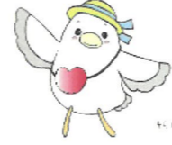
栄区福祉保健活動拠点 マスコットキャラクター「そらちゃん」

善意銀行へ金品のご寄付をありがとうございました。区内の様々な団体や施設等へ配分を行う財源として、活用させていただきます。