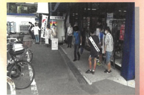
共同募金の呼びかけ (たまや上郷店)

生徒の熱意から始まったボランティアは、地域の高齢者を活性化したのはもちろん、生徒たちにとっても良い経験になったようです。