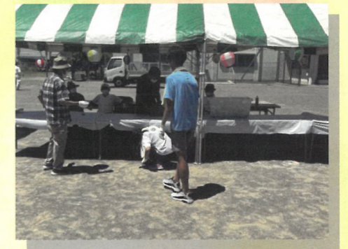
夏祭りの設営準備 (上郷ネオポリス)

令和4年6月、特定非営利活動法人「のあインターナショナルスクール」の生徒が来会し、ボランティアへの参加の相談がありました。生徒たち自身の話し合いの中で、『ボランティア活動をしよう』となったそうです。理由として、『学生のうちに社会奉仕活動の経験を積みたいと思ったこと、そしてフリースクールをもっと地域に開かれた場所にするために、まずは地域貢献からという思いがある』というお話でした。