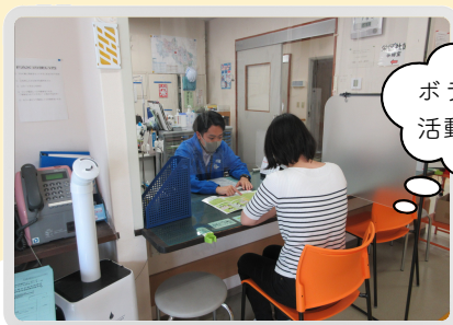
入ってすぐに受付窓口が あります。