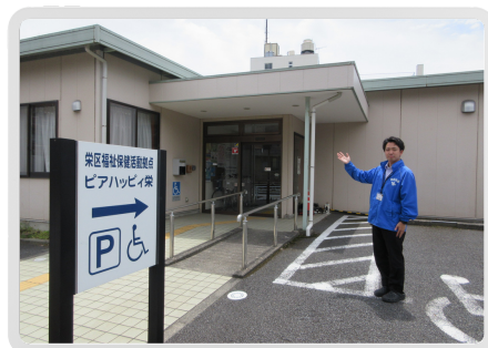
ここがボランティアセンターです！ 皆さんの好きなことや得意なことが ボランティア活動に繋がる可能性が あります。あなたのボランティア活 動を応援します！