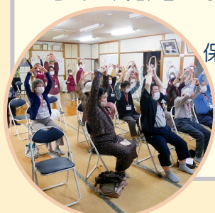
⇨ サロン・ド・アイ

* 活動内容：(例)茶話会でのおしゃべり、地域の高齢者や子育て世代、障がい者交流、レクリエーション活動、保健指導、居場所支援 など