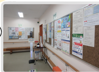
廊下にボランティア情報や イベントの掲示があります。