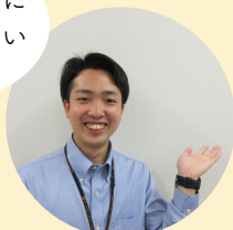
ボランティアセンター 担当職員