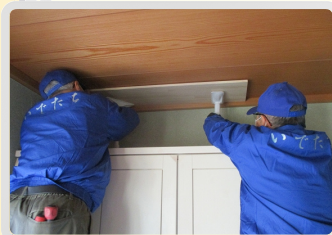
⇨ いでたちによる耐震補強の様子

* 活動内容：(例)買物代行又は付添、掃除、ゴミ出し、家具の移動や組立設置、電球交換、障子や網戸張り替え、話相手、草取り、庭木の水やり、その他軽作業 など