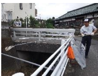
専用の竿を使っている様子